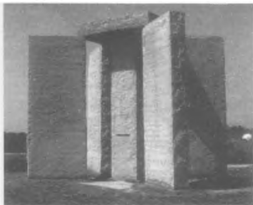
Slika 241: Džordžijske smjernice (Georgija Guidestones)

Taj je broj također ispisan na misterioznom spomeniku pod nazivom „Georgia Guidestones” („Džordžijske smjernice”) na kojem je navedeno deset temeljnih načela, ili ‘smjernica’, za novo društvo i to na engleskom, španjolskom, svahiliju, hindu, hebrejskom, arapskom, kineskom i ruskom jeziku. Kraća poruka na vrhu napisana je babilonskim, starogrčkim, sanskrtskim pismom te egipatskim hijeroglifima. Neki ga ljudi nazivaju „američkim Stonehengeom”, a kameni su blokovi poravnati sa Suncem i Mjesecom (sl. 241). Podizanje ‘Smjernica’ naručila je 1979. nepoznata osoba pod pseudonimom R. C. Christian, za kojeg neki smatraju