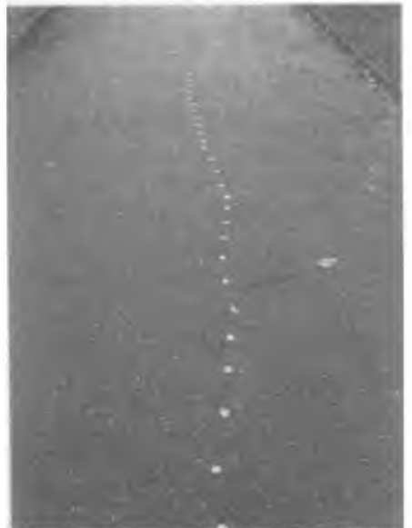
Slika 249: Na jednoj lokaciji 'mrlje' su slijedile praktički ravnu crtu.