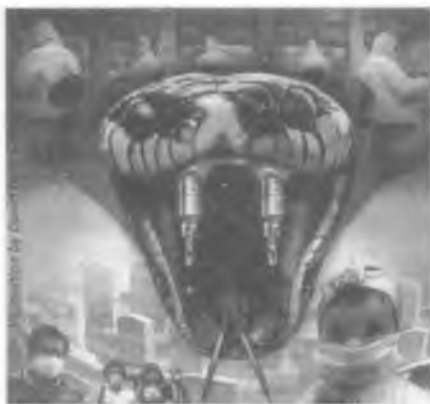
Slika 242: Obavezno cijepljenje jedan je od temelja gmazovske globalne fašističke države zbog utjecaja na ljudsko tijelo i um.

Ovaj tajni plan, objelodanjen 1990-ih godina, trebao je doprinijeti smanjenju rasta svjetskog stanovništva putem kontracepcije, ratova i gladi te iznošenjem prijetnji o uskraćivanju američke financijske potpore i pomoći u hrani kako bi se vlasti raznih država natjerale na suradnju. U „ispovijesti sa samrtne postelje” jednog sotonista kojeg možete pročitati u Dodatku II, kaže se da je cilj ukloniti „barem sedamdeset posto svjetskog stanovništva do 2030. godine”. Zaklada Billa i Belinde Gates, koja u značajnoj mjeri financira programe cijepljenja u „Trećem svijetu”, dodijelila je višemilijunske iznose organizaciji Planirano roditeljstvo (otac Billa Gatesa bio je vodeći član njena odbora) i drugim udrugama posvećenim „kontrolu rasta stanovništva”, dok je osnivač CNN-a Ted Turner darovao izdašna sredstva za 'ideju' o smanjenju stanovništva. Ustvrđio je da bi 95-postotni pad broja svjetskog stanovništva, na nekih 250 do 300 milijuna, bio idealan. Čak i same Gatesove nadmašio je njihov prijatelj, multimilijarder i financijer Warren Buffett koji se obvezao dati 37 milijardi dolara Zakladi Gatesovih, uz povećati dio organizacijama koje se zalažu za prorjeđivanje svjetskog stanovništva. 'Obamini' planovi za zdravstvenu zaštitu uključuju odredbe koje će utabati put od države financiranom pobačaju bez ograničenja, što je još jedan aspekt plana za smanjenje stanovništva, kako je još 1969. predvidio dr. Richard Day.