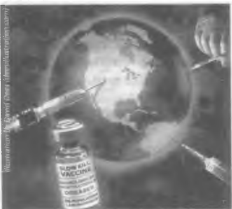
Slika 244: Njihovim se planom ne predviđa masovno ubijanje ljudi cjepivima jer bi to bilo previše očito i ljudi bi shodno tome reagirali. Zadani je cilj, ustvari, sustavno narušavanje čovjekovog imunološkog sustava.