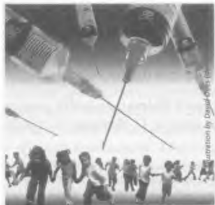
Slika 246: Uz isplanirano cijepljenje obitelji odabranih krvnih loza ciljaju na djecu više negoli na bilo koga drugog kako bi ih pretvorili u poslušne male robote s doživotno oslabljenim imunološkim sustavom.

kojom potvrđuje da je timerosal toksičan za nerođeno dijete (fetus). Pa, pogledajte kako su s cijepljenjem posebno ciljali na trudnice (drugim riječima, njihove nerođene bebe), djecu i mladež. Upravo će ti naraštaji biti odrasli ljudi u planiranom Novom svjetskom poretku, orvelovskoj globalnoj državi. Oni žele uništiti njihov imunološki sustav i destabilizirati ih mentalno, emocionalno i ‘fizički’. U cjepivu protiv „svinjske gripe” nalazi se i aluminijev hidroksid, a odavno se zna da aluminij uzrokuje oštećenja mozga. U istom mjesecu kad je „svinjogojskoj farmi u Meksiku”, Journal of Inorganic Biochemistry je objavio studiju koja povezuje ubrizgavanje aluminijevog hidroksida s propadanjem motornog neurona te s ostalim oštećenjima mozga. ‘Testiranje’ cjepiva H1N1 namjerno se požurivalo, a pravdalo se umjetno izazvanom histerijom kako bi se izbjegnula mogućnost da se posljedice otkriju prije no što bude prekasno. Imajući u vidu takvu pozadinu, svjedočili smo sramotnim postupcima vlasti i medija koji su se obrušili na djecu i njihove roditelje, tjerajući ih manipulacijama da se „obavezno cijepi” (sl. 246). Posebno nevjerovatna bila je metoda kojom su se poslužili na televiziji. Radilo se o jednoj od epizoda animirane serije Sid the Science Kid koju je snimila Henson Company ,