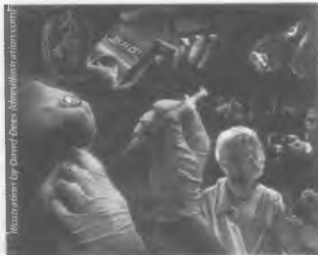
Slika 243: Svjetsku zdravstvenu organizaciju stvorili su Rothschildi i Rockefelleri kako bi određivala svjetsku 'zdravstvenu' politiku. Njene mračne nakane uključuju obavezno cijepljenje.

On navodi da je jedan od vodećih znanstvenika Ujedinjenih naroda - koji je istraživao pojavu smrtonosnog virusa ebola u Africi, kao i žrtve AIDS-a - zaključio da virus svinjske gripe H1N1 ima određene 'vektore' prijenosa koji ukazuju na to da je novi soj gripe genetički proizveden kao oružje biološkog ratovanja (sl. 244). Neki istraživači kažu da trag soja „svinjske gripe“ vodi do rada dr. Jeffreya Taubenbergera i ekipe genetičara i mikrobiologa u vojnom Institutu patologije u Fort Detricku u Marylandu, koji su pomoću superračunala mapirali ili ostvarili „reverzni inženjering“ soja gripe koji je 1918. pobio desetke milijuna ljudi. Tvrdi se da je taj virus potom dan Novartis u. Srećom, u vrijeme pisanja ove knjige u optjecaj nije pušten niti jedan toliko otrovan soj, a višemjesečna fantastična internetska kampanja razotkrivanja opasnosti od tog cjepiva osujetila je prijevaru sa svinjskom gripom: tek je manji dio predviđenog broja ljudi pristao na cijepljenje. A to je znak da nastupa vrijeme buđenja jer sve veći broj ljudi otvara oči i uviđa kakav svijet zapravo jest. Gore spomenuta klika nesumnjivo će još jednom pokušati, bilo s pojačanom „svinjskom gripom“ ili s nečim drugim, a mi se tome moramo čvrsto oduprijeti, uvijek iznova, koliko god puta bude potrebno.