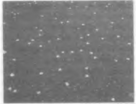
Slika 247: 'Žvakaće' koje su izbacili zrakoplovi u niskom letu iznad moga grada.

Zanimljivo je kako ih ljudi ne primjećuju sve dok im netko na njih ne ukaže. Redovito ostanu zapanjeni njihovom raširenošću i čude se kako ih prije nisu uočili. Mnoge od tih mrlja, čini se, imaju na sebi nekakav znak. Uobičajeno a besmisleno objašnjenje glasi da je „to samo žvakaća guma”. Kao prvo, takvih