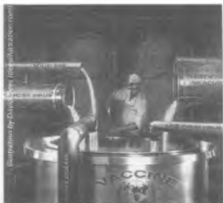
Slika 245: Cjepiva ne štite ljudsko zdravlje... uništavaju ga.

Cjepivo protiv „svinjske gripe” osim toga sadrži otrove poput timerosala (žive) i aluminijskih soli. Američka vlada je objavila da zbog ‘pandemije’ „privremeno uklanja” ograničenja u vezi količine žive (timerosala) dopuštene u cjepivu H1N1 koje se daje trudnicama i djeci mlađoj od tri godine. Živa je smrtonosni otrov za mozak koji se posve opravdano povezuje s autizmom kod djece, a mijenja i moždane funkcije. Trudnice se, inače, upozorava da ne jedu tunu zbog moguće prisutnosti žive da bi se potom vlada i ‘zdravstvene’ službe složile kako živu trudnicama treba ubrizgati! (sl. 245). U lipnju 2009. profesor Chriss Shaw sa Sveučilišta British Columbia objavio je studiju u znanstvenom časopisu Toxicological and Environmental Chemistry