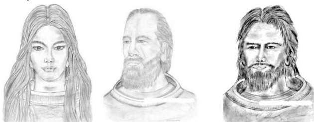
Nordijci ili Plejareni

Plejade su mali zvezdani oblak koji se na severnom nebu vidi tokom zimskih meseci. Sedam zvezda (šest ih je vidljivo golim okom): Atlas, Alcyone, Merope, Electra, Maia i Taygeta. Našem Sunčevom sistemu treba 25.827,5 godina da jednom rotira oko Plejada. (Velika Keopsova piramida u Gizi: dijagonale na bazi piramide iznose 12.913,75 piramidalnih inča. Pomnožimo li ih s dva, dobije se tačno 25.827,5). Zvezdani sastav Plejada ima preko 2.300. individualnih zvezda. Domovina Plejadanaca je oko sistema Taygeta, udaljenog 500. svetlosnih godina od Zemlje. Njihova populacija iznosi oko 127. milijardi.